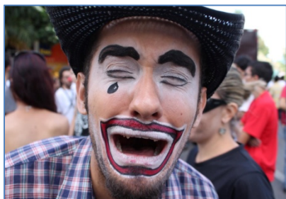
Servidor no dia da Folha de Pagamento: - "Oh Sofrimento!"

Preparem-se Associados, pois novidades amargas estão próximas de serem aprovadas nas próximas semanas. Foi noticiado pela imprensa que Secretários de Fazenda estiveram reunidos em 07/03/2016 e acordaram medidas que deverão alongar o prazo de pagamento das dívidas dos Estados com a União. Apesar do turbulento momento econômico, sabe-se que o ritmo de crescimento do país segue lento. No bom "economês": Sem crescimento e sem consumo, a arrecadação diminui, e há mais redução de despesas. Agora, cogita-se a volta da CPMF (Antigo "Imposto do Cheque"). Assiste-se o velho filme que se reprisa de tempos em tempos. Mas há uma novidade nisso tudo. Uma das medidas a serem tomadas e que deverão estar previstas em lei é: Limitar gastos com funcionalismo e as reposições salariais com a Receita Corrente Líquida (RCL) . Apesar de ser um conceito técnico, a