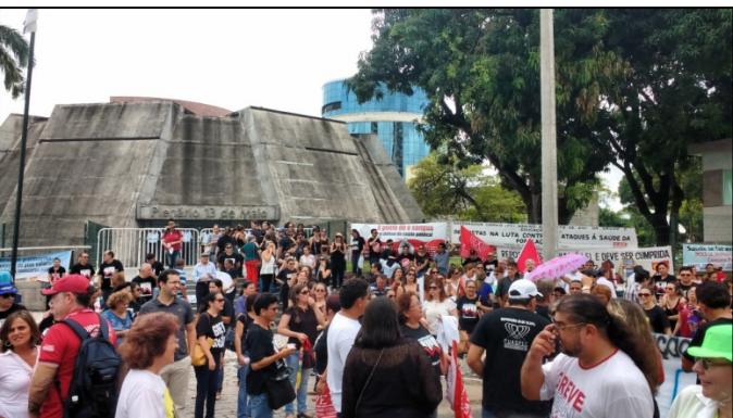
2. Mobilização na Assembleia Legislativa

Mais uma vez enaltecemos os GUERREIROS "SEPLAGUEANOS", onde nesses dois dias de paralisação, representados pelos servidores lotados nas diversas coordenadorias (CPLOG, COGEC, ASJUR, COPAT, dentre outras) se manifestaram