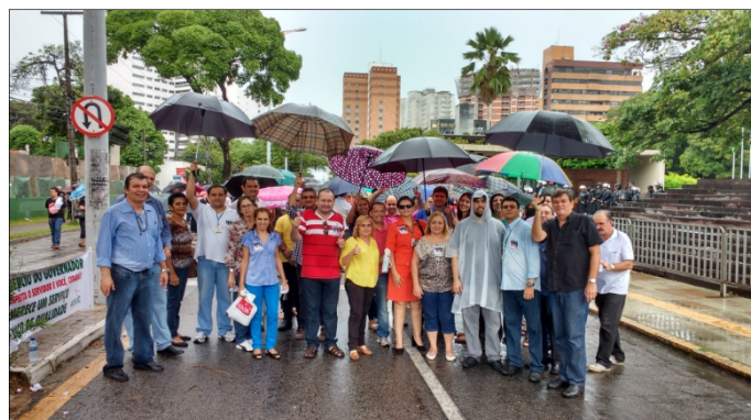
1. GUERREIROS SEPLAGUEANOS

Interagimos com outros colegas de diversas repartições como SEFAZ, DETRAN, SEDUC, PREFEITURA DE FORTALEZA, UNIVERSIDADES, SESA, POLICIA CIVIL, dentre outros. A palavra e os sentimentos eram os mesmos: PREOCUPAÇÃO, ANSIEDADE e DESGOSTO.